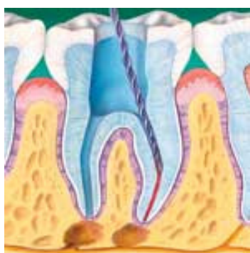
gereinigte Wurzelkanäle vor der Füllung