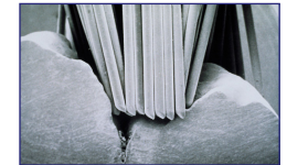
Fissur/Borsten unter Mikroskop

Hauptsächlich die Kauflächen der Backenzähne und besonders deren feine Grübchen und Vertiefungen, die sich nur schwer mit der Zahnbürste reinigen lassen.