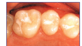
Fertige Versiegelung im Mund

Die Versiegelung der Backenzähne wird von den Krankenkassen übernommen. Die Versiegelung weiterer Zähne kostet ca. 20,- Euro je Zahn. Private Krankenkassen übernehmen die Kosten für sämtliche Zähne.